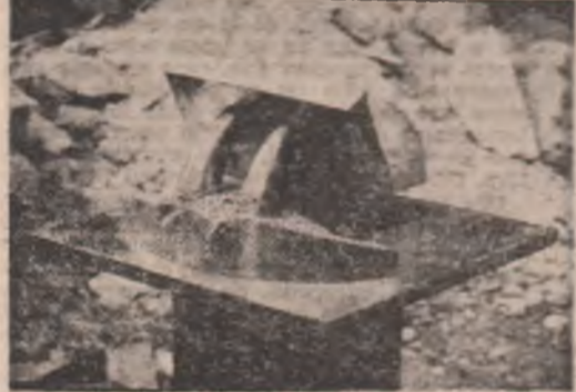
(Fragment din romanul cu același titlu)