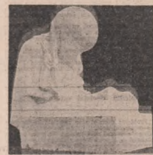
Sculpturi de Ion Măndrescu