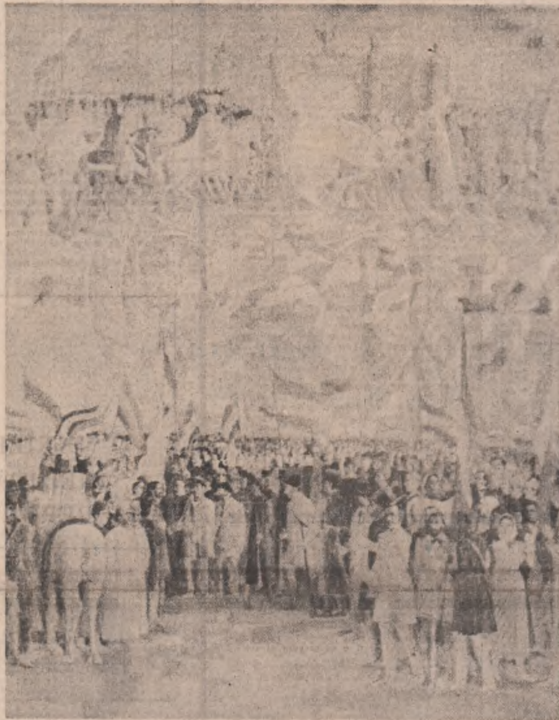
Vasile Pop Negrețean: „1918”