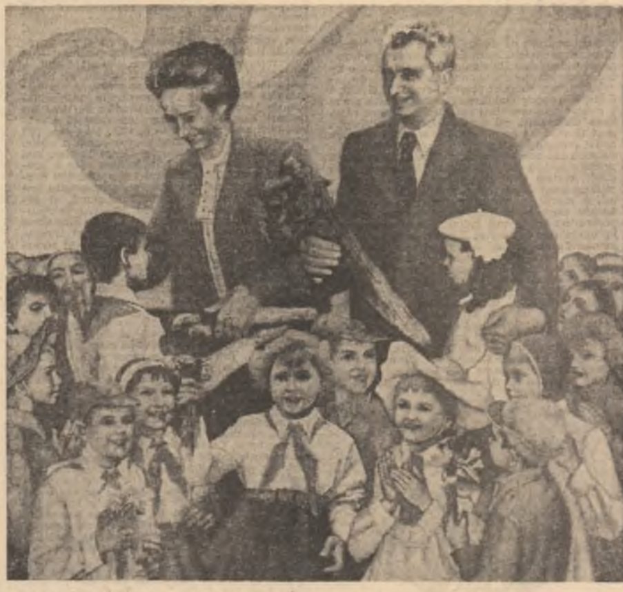
Tablou de C. Nișescu

reanu care, în '87, la Olimpiada Internațională de Fizică, a impresionat prin perfectiunea lucrărilor sale, clasîndu-se pe primul loc la marea diferență față de toți ceilalți participanți — după ce el însuși adusese în discuție postularea „Știu și eu 7 mi-a răspuns. Cred că lina de fiecare, poate să fie și un dat al său dar cu siguranță este vorba, cel puțin în început, de ceva mai multă curiozitate și ceva mai multă perseverență în aprofundarea aceluiași domeniu ce, la un moment dat, te-a fascinat. Apoi te trezești că fără el nu se poate...”