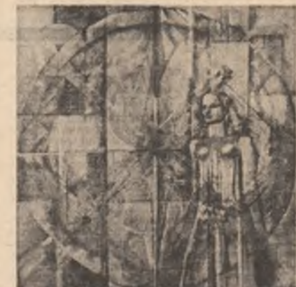
Geta Mermze: „Șantier”