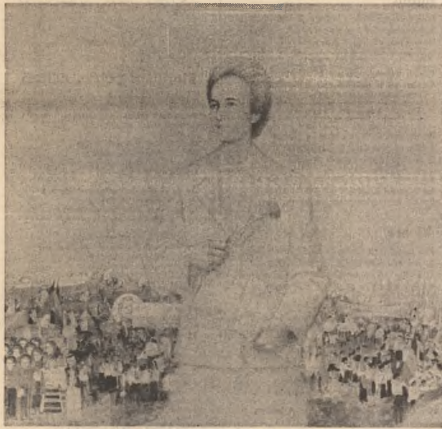
„Zi de sărbătoare” — tablou de Vasile Pop Negrețean