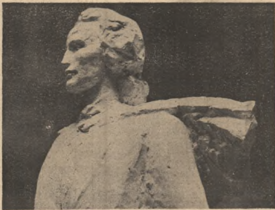
„Eminescu” — sculptură de Gabriela Manole Adoc