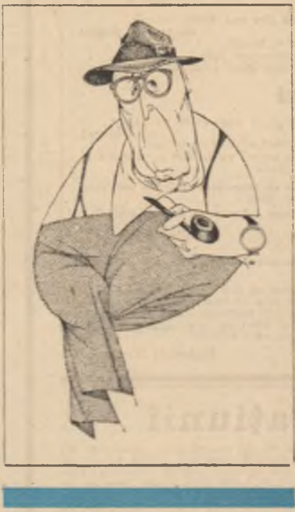
liberat în cea mai mare parte prin romanele mele.

Georges Simenon la cei 85 de ani ai săi, cu aspectul său de rafinată siretenie și cu pipa veșnic în gură este, fără îndoială, una dintre referințele paradigmatiche ale romanului polițist. Comisarul său, scutulul XX, cucurindu-și acești importanți de care se bucură, de exemplu, Hercule Poirot.