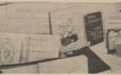
Recenta lucrare cu caracter bibliografic îngrijită și multiplicată sub egida Bibliotecii Centrale Universitare din București, purtând titlul "Mihai Eminescu pe meridianele lumii"...