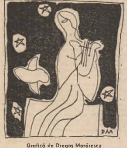
Grafică de Dragoș Morărescu