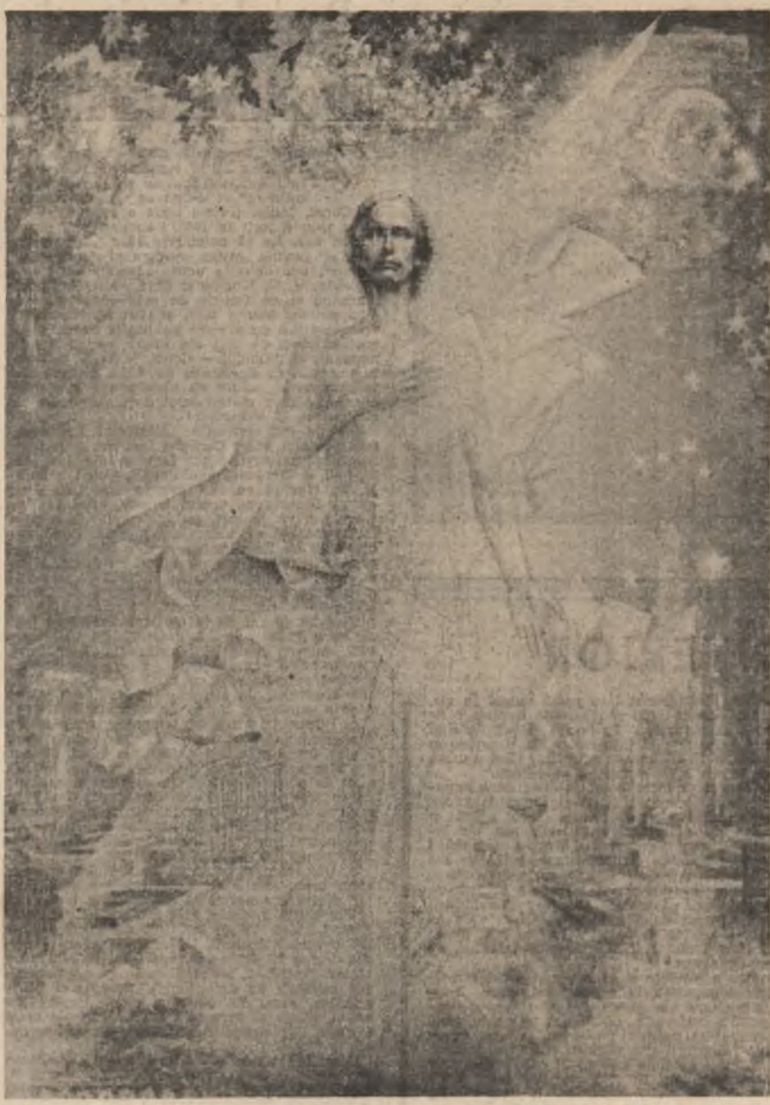
„Eminescu” — tablou de Vasile Pop Negreștan