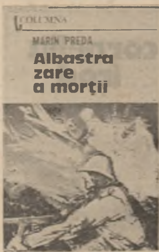
Albastră zare a morții