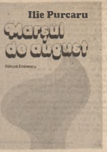
Marsul de august