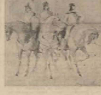
Tableu de Bogdan Sibî