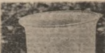
I. Sabău : „Ce te legăm codrului...”

Mă tem de tăcerea muntilor Și de înalțul dincolo de ei, De toate gândurile nevăzute Care se risipesc în noaptea singurătății. Dar cel mai mult mă tem de mine cînd te voi sîrta, mine, în prag.