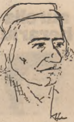
Desen de Luminița Tudor