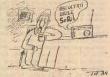
Desen de TOPAN

„Itapid”. Chiar dacă partidul său va retrograda în divizia C, îl va urma fără șovăială, pînă în pinzele albe sau în negrul abatajelor. Nu dă doi bani pe argumentația logică; nu simte, de altfel, nevoia să argumenteze sau să asculte argumentele altcuiva. (Nu poți lămuri un iraniam de bine că Ayatolahul a făcut sau a dres). Nu e, totuși, periculos. Nu devine agresiv decît pe cale bucală, exprimarea curentă fiind cea de stadion, agrementată cu fluierături și huidueli. Nu e violent, dar aplaudă violența confrăților mai energici. Minerii? Păi, fără ei, ce s-ar fi întimplat? (Ce s-a întimplat cu ei, cu-