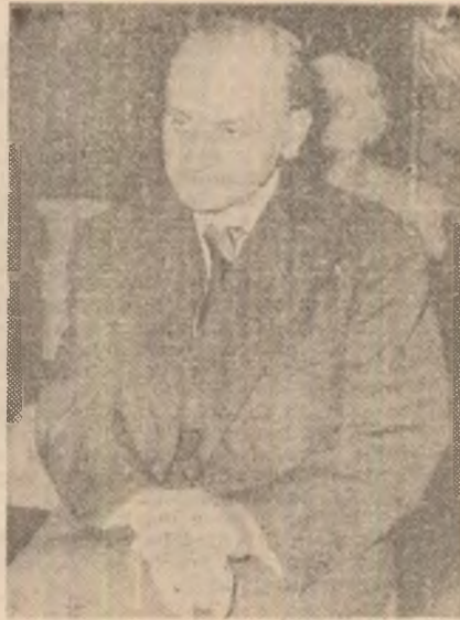
Constantin Noica după Despărțirea de Goethe (1976)