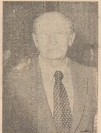
D. I. Suchianu printre Vedetele filmului de odinioară