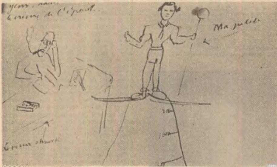
Desen trimis soției sale în ianuarie 1928

Jurnalul lui Drieu este un document extraordinar al nihilismului intelectual fascist. N-am întîlnit nicăieri altundeva exprimată mai sincer mentalitatea acestee extremistă de dreapta, cu toate fantasmeele ideologice pe care si le-a creat. Drieu nutrește o aversiune aproape viscerală față de Franta burgheză, asa cum arăta ea după victoria în primul război mondial. Printr-un travaliu imaginativ paranoic, nihilismul antidemocratic fascist face din a III-a Republică o expresie tipică a decadentei: Sistem parlamentar neputincios, stat corupt, condus din umbră de capitalul financiar iudaic și francmasonerie, clasă politică versatilă și inconstientă, natiunea îmbătrînită în declin demografic, dedată exclusiv micilor plăceri menajere, degenerare intelectua-