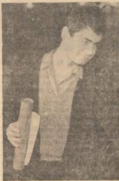
Proză : Cătălin Țirlea