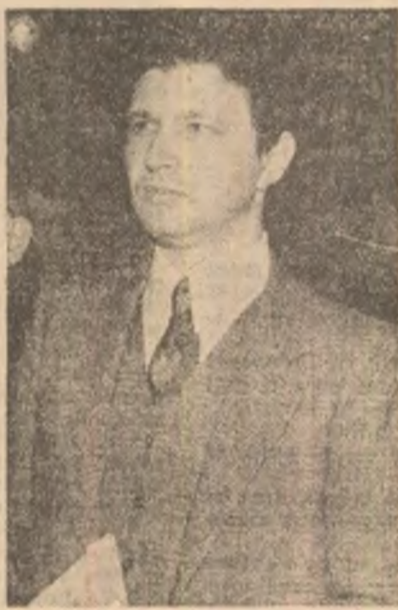
Critică : Vasile Spiridon