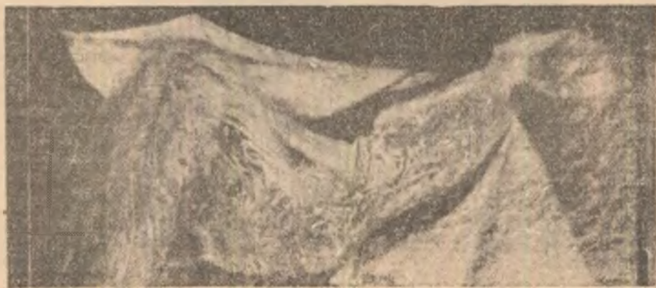
Urmare din pag. a 10-a

Atunci cînd spun, asadar, „cred (numai) în Om“ nu pot evita străvechea psalmistului întrebare: „Ce este omul, Doamne, ca să te gîndesti la el?“ Ce este omul în esența lui? Care este esența umanului? Care-i este ființa? Și în clipa în care m-am întrebat — și mă întreb — Ce este