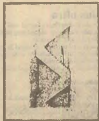
Partida de biliard din pădurea rusească

trăite”. Este greu de vorbit despre acest eveniment personal, cum difilic îi este poetului să-l toarne în vers. „Moartea soției, după un deceniu de suferință” impune volumului o structură binară, trecut/ prezent, sau potrivit celor două cicluri care îl compun: „Elogiu vârstei mistice” (trecut) și „Cu exilații și cu morții” (prezent). Moartea ființei iubite solicită poetului o relație nouă și complexă cu propria lui biografie și cu principiile proprii de artă poetică, reasezând altfel termenii viață/ creație: „exorcizarea biografiei din poem/ mi-a răpit cei mai frumoși ani/ și tot acolo am ajuns: la ceva/ ce trebuie spus pe nerăsuflăte, ca rupt din viață” (p. 54). Clipa confesiunii, a imixtiunii autobiografice e imperativă: „Dacă acum nu mărturisesc nu voi mărturisi niciodată”. Poemele din volum sunt poeme despre moarte dar mai cu seamă despre iubire.