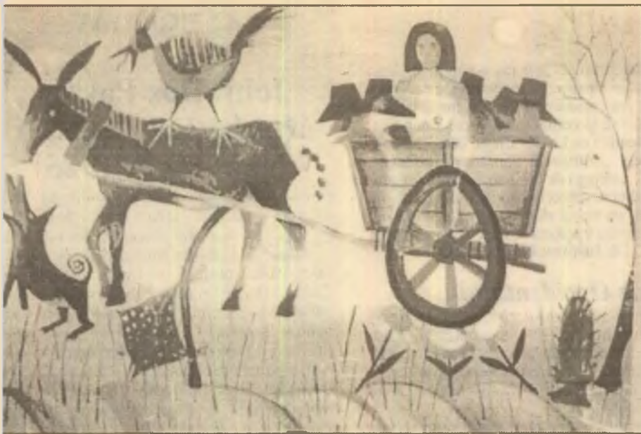
Un măr ilustrat cu reproduceri după lucrări din expoziția de acuarelă și desen Aurel Gheorghiu-Cogea, deschisă recent la Galeria Calderon