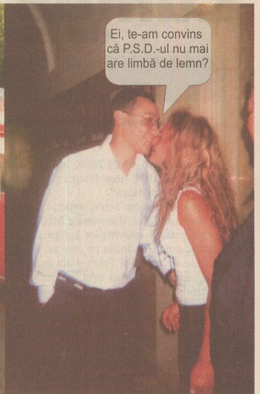
Don Juanul P.S.D.-ist Victor Ponta într-un scurt popas afectiv la Deva, via Brad