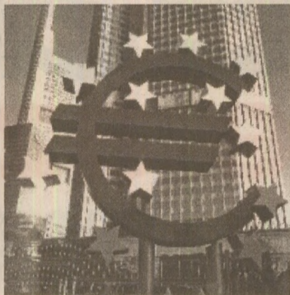
Permis de muncă pentru Austria

Pentru informații suplimentare poate fi consultată pagina de web www.ministerosalute.it .