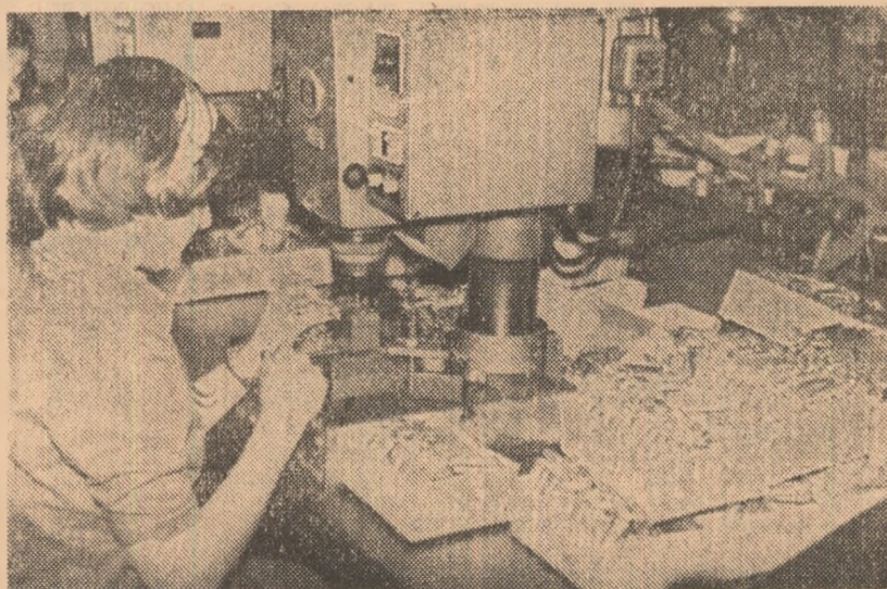
Produsele de feronerie fabricate la Arad au înlocuit pe cele din import. Sunt folosite de toate fabricile de mobilă din țară.

Înaltă productivitate și în același timp o calitate deosebită a determinat apariția combinatelor de prelucrare a lemnului. La intrarea în funcțiune a Combinatului de prelucrare a lemnului de la Arad se executa o singură garnitură de mobilă-corp (în serie) și câteva tipuri de scaune curbate. Datorită dezvoltării combinatului, diversificării producției, dării în funcțiune a noilor obiective și lărgirii capacităților existente, s-a ajuns în prezent la realizarea a peste 230 sortimente de mobilier pe an. Aceasta înseamnă numeroase garnituri și piese separate de mobilă: stil clasic, rustic, colonial și modern. Dintre produsele reprezentative de mobilier proiectate și executate la Arad, amintim programele de fabricație pentru garniturile stil Regency, Ludovic al XVI-lea, Nina și 623.