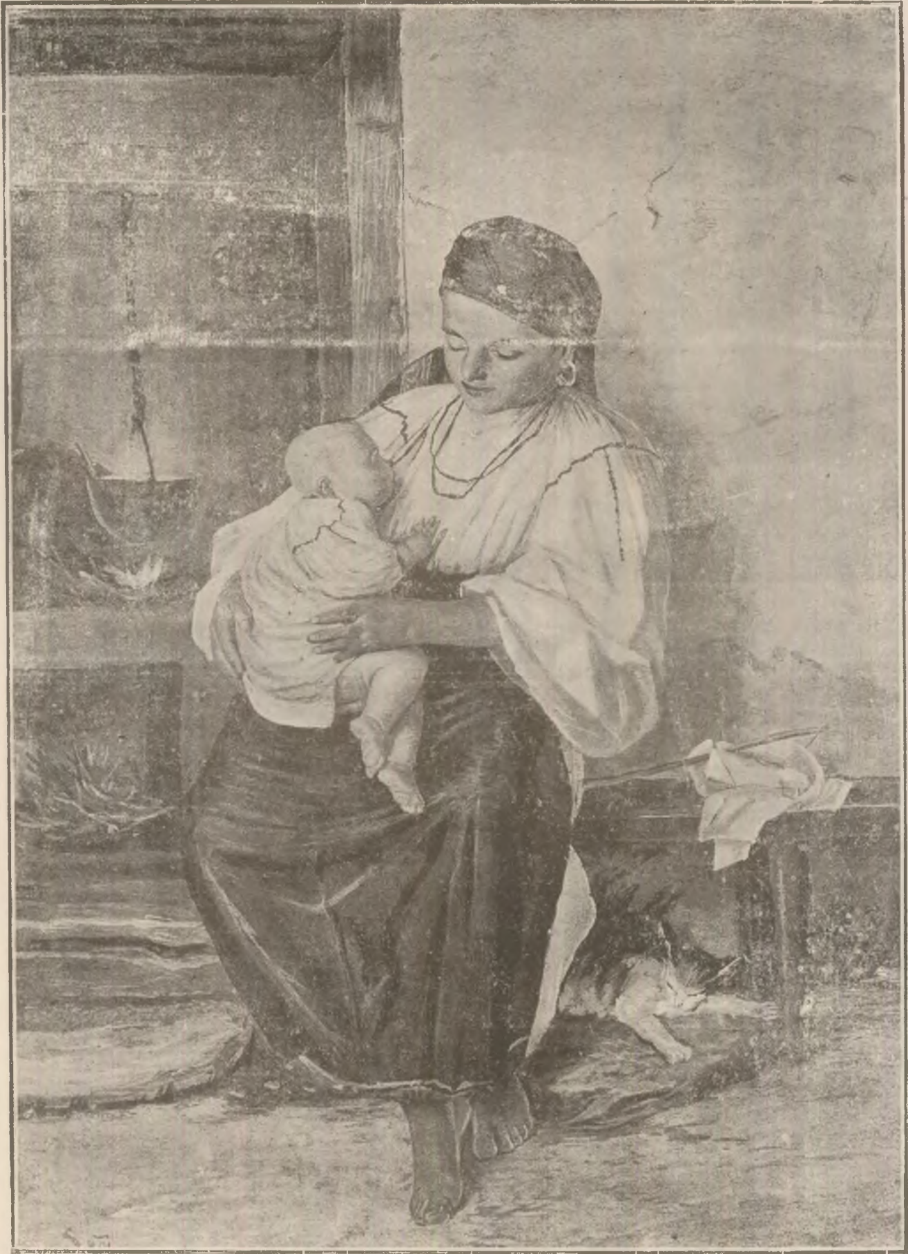
Româncă din jurul Sibiului.