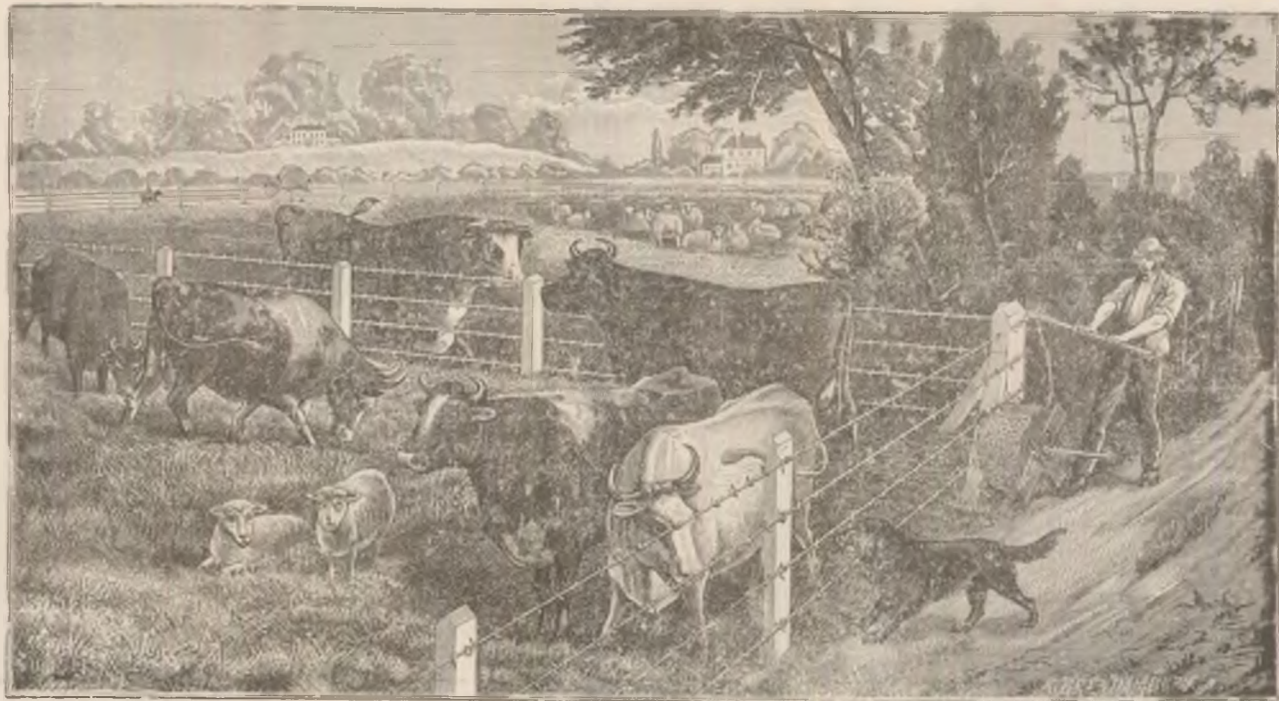
Ocol de câmp ce se pote strămuta ușor.

— Nu vă înțeleg, răspuse cu respect tinerul.