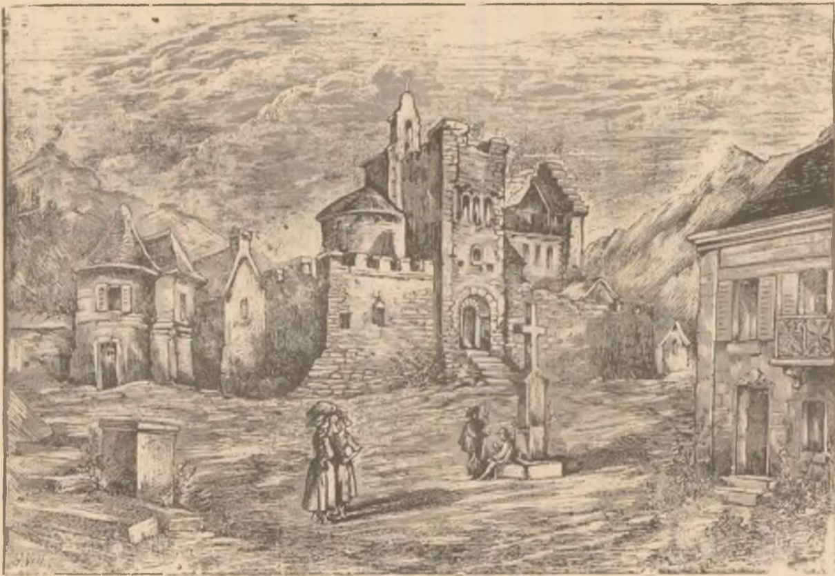
Biserica Templierilor din Luz.

Ion: (cu capul rășinat pe mână, superat și desperat) Iacā dragă, ce: Ađi diminețā... ca de comun merg la fratele Smārdan în birou și-mi scot lēfa... vream rogate sē-ți cumpār ceva cadou pentru ziua de mână... El mē primesce rece, imi numērā banii și-mi dice urmātoarele vorbe: „D-l meu, dupā ce în timpul din urmā esci mereu distras, dupā ce nu mai lucrī cu acelaș zel ca mai naintē, vei putea judeca însuși, că aceste sunt împrejurāri carī nu se pot uni cu mersul regulat al unei bănci cu renume, cum e banca mea. Dupā ce eu m'am hotārīt, că în timpul proxim o se mē însor...”