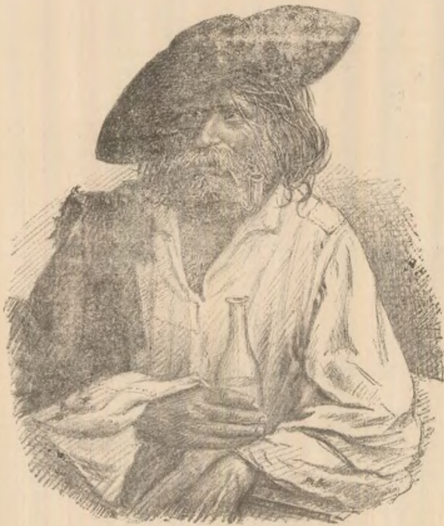
Un țigă în tipul său original.