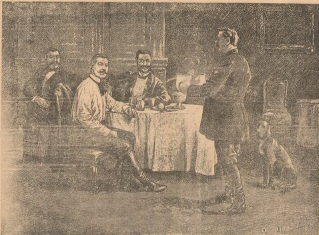
In sala de Crăciun.

O! Mureș, apă lină și Tisa, apă neagră, Când merg pre-al vostru termur, păreu de lacrimi vers: Când merg pre-al vostru termur, o carte mare-ntreagă Cetese în apa voastră, plângând, ce fugi în mers. Și nu este inima în carea s'ar fi scers (Inimă românească) și-n carea să se-n nece A timpului pomene și-al Sorții negru vers: Pân' (ine Tisa neagră și Someșul cel rece, Pân' stau Carpați 'nsore, se trece cât ar trece?!