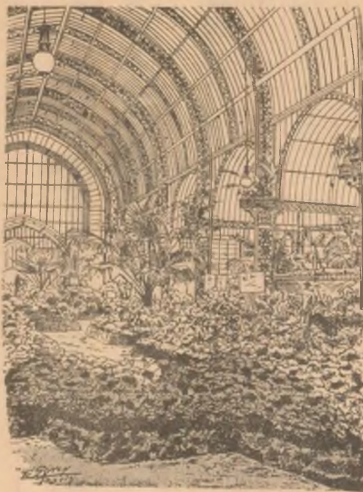
Interiorul unei seră la Exponziție în timpul Concurșului