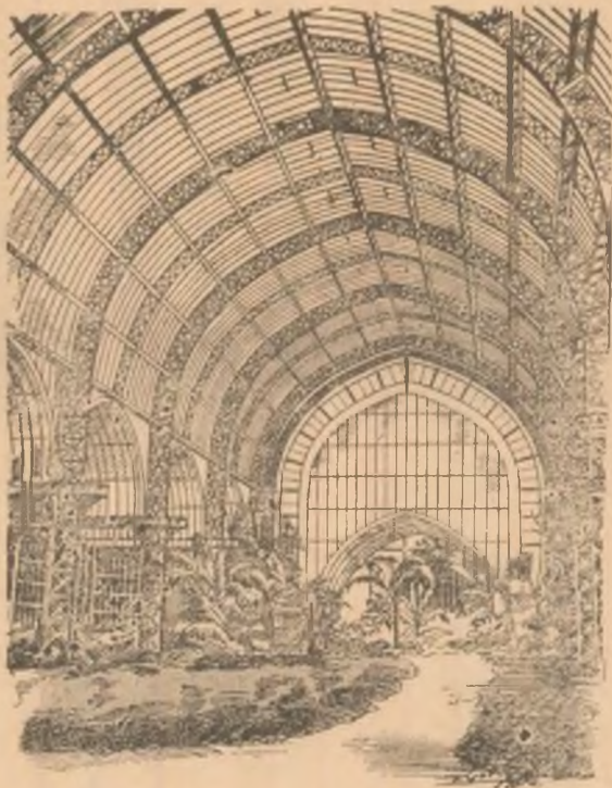
Interiorul unei seră la Exponziție înainte de Concurș.