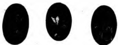
Fotografii de ale cetitoarelor Revistei.

— Mamă — zicea Șofrona, — nu știu ce, așa mi-e de dragă lumea asta câte-odată, așa o ved de frumoasă oarecum; să tot trăiești și să nu mai mori. Gîndești că ved stele luminînd, flori înflorind; și când stau așa singură colea sub poala pădurii, mi se pare că așa de frumos aud un cîntec dulce, ca din cer, un cîntec