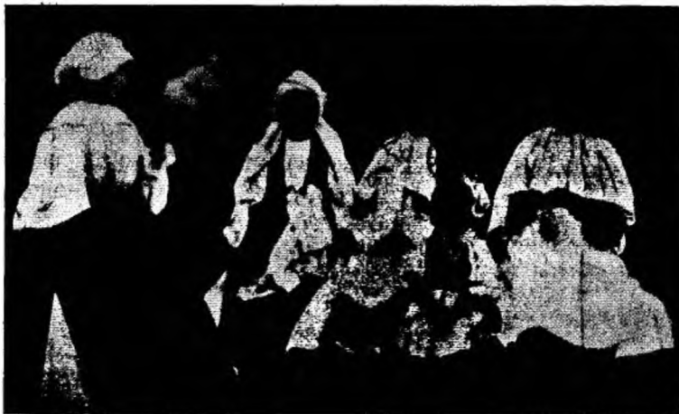
Noi ținem Joile.