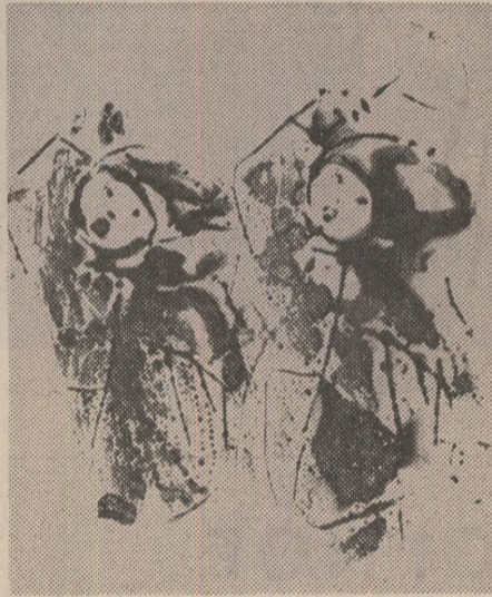
Desene de Constantin Baciu