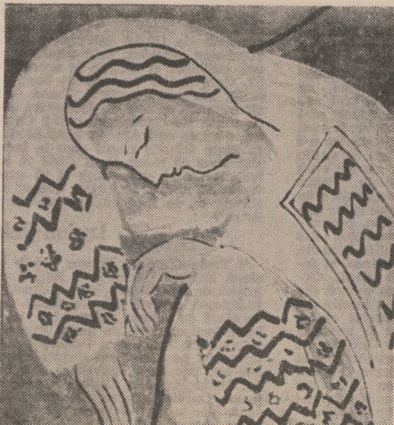
MATISSE — lia românească