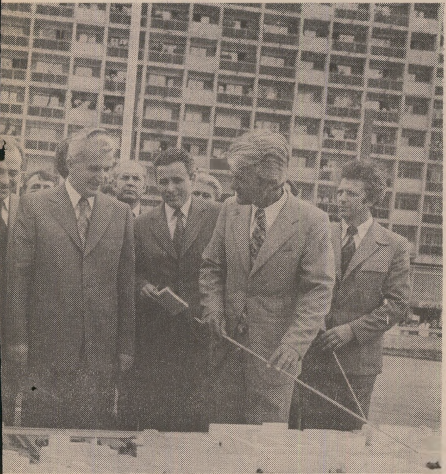
La inaugurarea pasajului Bucur-Obor

net de convergență, stranie alcătuire de genisme și obiceiuri ciudate, provenite fondul (arhaic, ar spune un folclo- ) fiecărei familii stabilite pe aici cine când, cine știe de unde și cine mai de ce venturi minată. Pe undeva, ghicita și nici acum nu prea cunos- minăstirea Plumbuita, punct de cul- în secolul 16, își oferea zidurile unui nemișos și unei privești nu tocmai uite cu prestigiul ei.