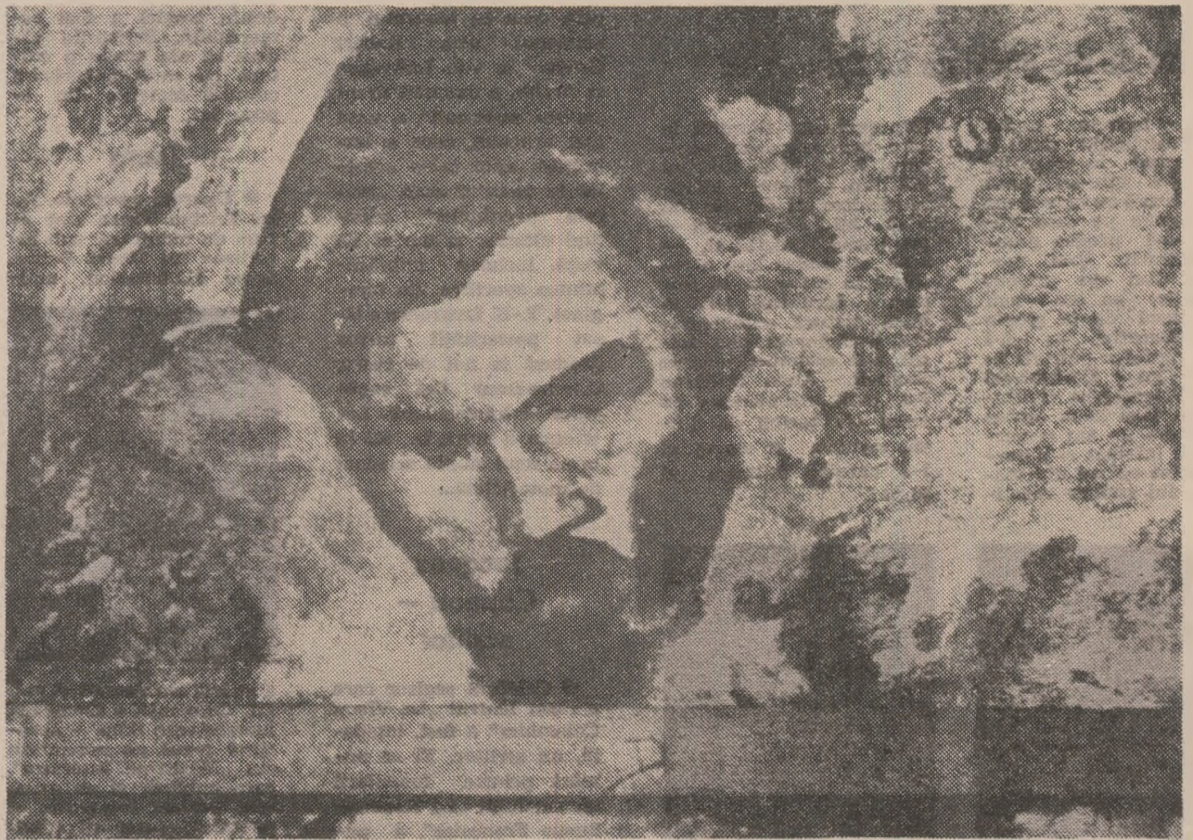
BRANCUȘI — portret de Modigliani