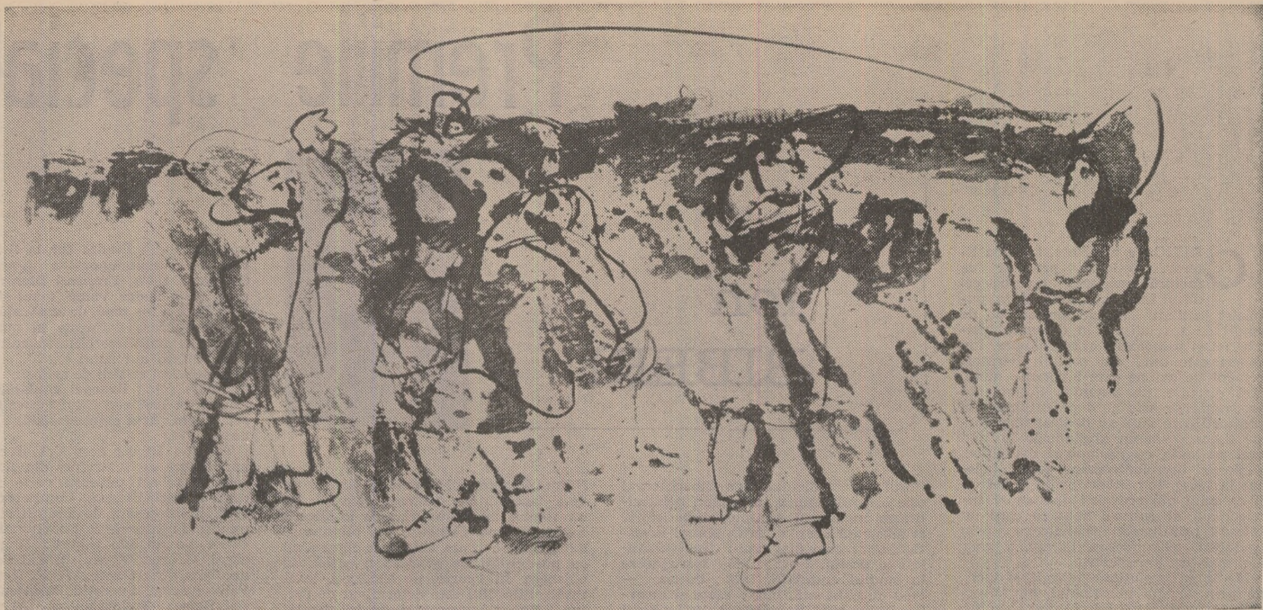
Desen de Constantin Baciu