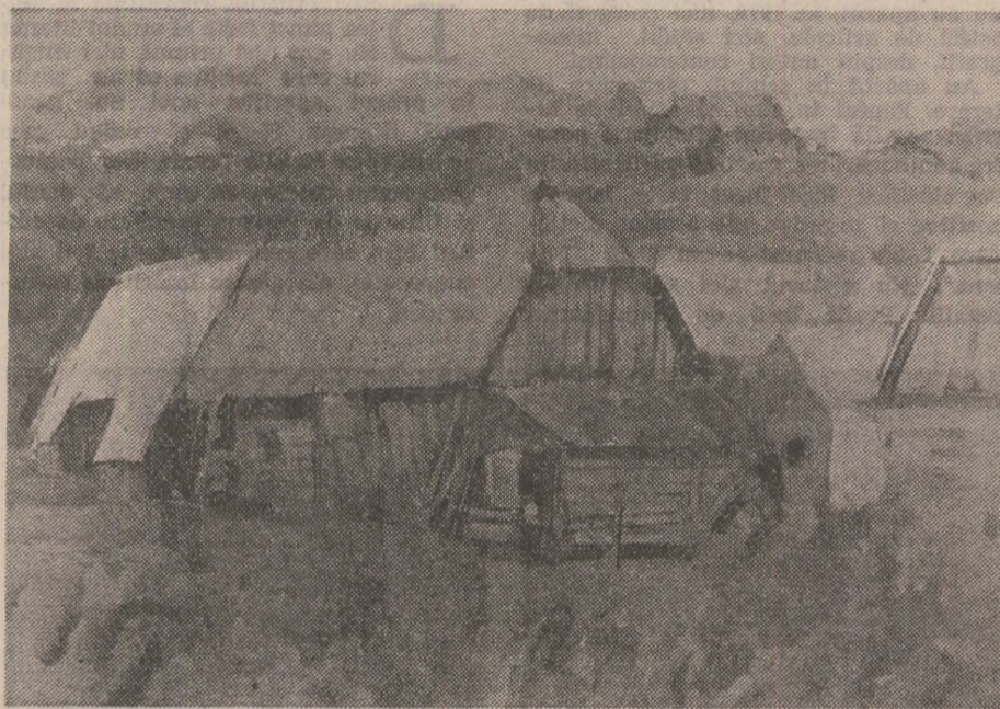
HORIA ROȘCA: Șopru cu lemne (Din expoziția deschisă la Galerile de artă ale Municipiului București)

Priveliștilor de coșmar ale unei lumi tinzînd spre autodistrugerea fizică li se adaugă imaginea degradărilor lăuntrice și aici „omul mulțimilor” lasă loc poetului să glăsuiească; iar mesajul acestuia privește dezumanizarea prin dis-