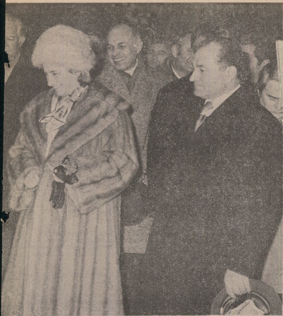
La inaugurarea primului tronson al metroului bucureștean