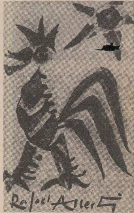
Rafael Alberti — desen în exclusivitate pentru o copertă a „Secolului 20”

Toți au scormonit cu degete infierbîntate marmura liniilor care-i brodează formele invulnerabile ale trupului gol. Dar nimeni n-a putut s-o profaneze mai înainte de a-și fi vindut sufletul Taumaturgului.