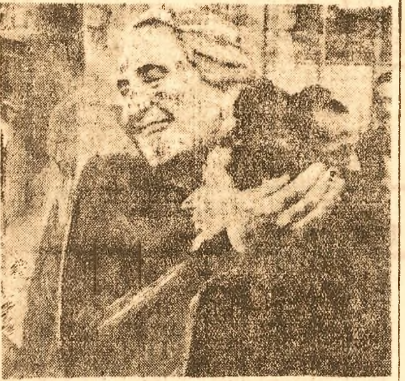
DOLORES IBARRURI — LA PASIONARIA

Al doilea război mondial a pricinuit Uniunii Sovietice pagube și distrugeri nemăsurabile. Femeile sovietice, care au îndurat din greu ororile agresiunii fasciste, urmând îndepărtate locul imperiului internațional, care începe să tăvălească omeniarea într-un nou război mondial. Ele veghează neclintite ca pacea să domnească în lumea întreagă, ele veghează la interesele democrației.