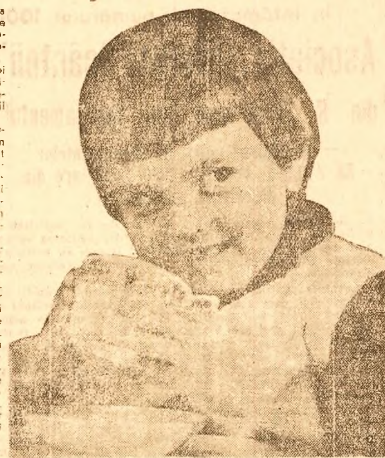
Copii în provincie 3 centre cu 750 de copii.

De mâine începe „Săptămâna copilului”. Intregul popor este chemat să sprijine acțiunea Comitetului Național pentru Ocrotirea Copilului. Este datoria fiecăruia din noi să luptăm ca această „Săptămână a copilului” să se prefacă într-o sărbătoare a țării întregi.