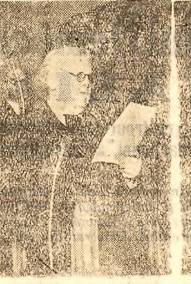
Mihail Sadoveanu membru în Prezidiu