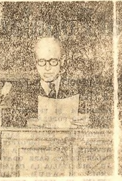
Prof. C. I. Parhon membru în Prezidiu

Parlamentul român a avut ieri o ședință istorică menită să deschidă o eră nouă în viața poporului român. Reprezentanții națiunii sosiți în grabă din toate colțurile țării așteptau încă de la orele 5 după amiază pe culoarele Camerei și în încălțările marelui eveniment, asupra cărora urmau să se pronunțe. O imensă bucurie puseseră stăpânire pe toți participanții la această solemnă ședință. Dela furtive luminoase ale deputaților și până la voioșia populară din balcoanele întesate până la refuz cu cățepeni din diferite straturi sociale — totul arăta adăncă satisfacție și imensă ușurare de a fi îndălțată încă o dată în drumul dezvoltării ferice a poporului nostru, de a fi făcut încă un pas înainte pe calea democrației populare spre socialism. La ora 6, nerăbdarea ajungese la cîmpe. Se stia că guvernul se află în camera mîștrilor și se pregătise să intre în încălț. Furtive speculă a „Șcanteii” anunțând evenimentul abdicării regelui este răspândită pe culoarele și smulși dintr-o mână într-alta.