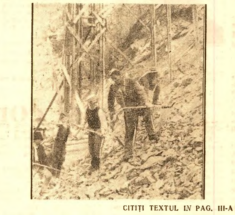
CITIȚI TEXTUL ÎN PAG. III-A

(Reportaj de pe șantierul ce poartă numele tovarășului Gh. Gheorghiu-Dej)