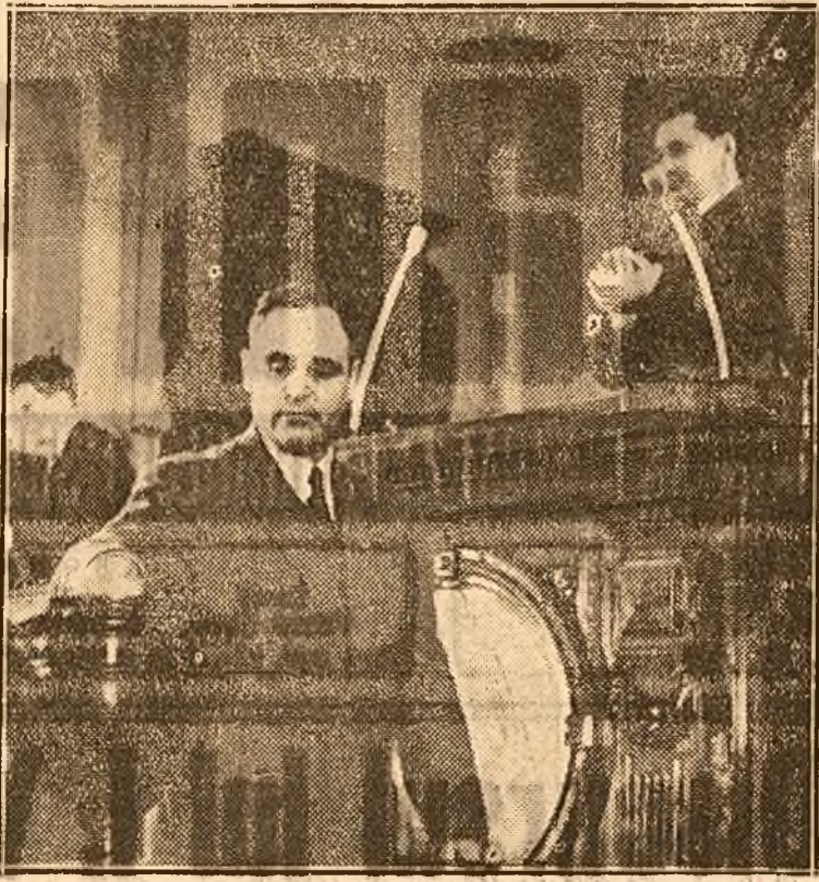
Tov. Gh. Gheorghiu-Dej votând Constituția

Adunări Naționale, se ridică: „DIN ACEST MOMENT TARA, POPORUL NOSTRU REPUBLICA NOASTRA POPULARA, AU O NOUA CONSTITUȚIE...”. Atât de mărețe sunt clipele pe care le trăești, atât de covârșitoare emoția, încât uitându-se în jur la deputații care