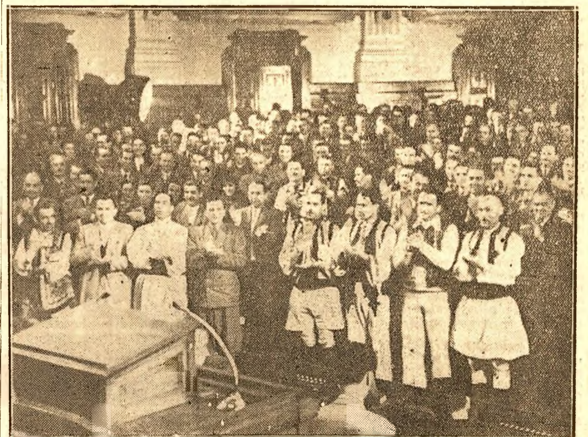
In momentul când tov. Gh. Apostol anunță votarea în unanimitate a Constituției, deputații aclamă puternic.

Ziarul mai este editat în limbile naționale în Jugoslavia, Bulgaria, Polonia și Italia. Recent, — după cum anunță ziarul „SZABAD NEM“ organul central al partidului comunist ungar, — a apărut și în limba maghiară, la Budapesta organul Biroului Informativ al partidelor comuniste și muncitorești PENTRU PACE TRINICA, PENTRU DEMOCRAȚIE POPULARĂ!