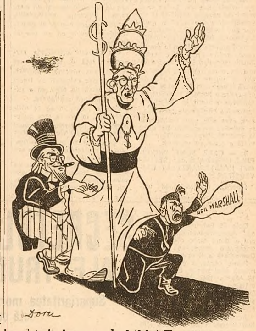
Myron Taylor, trimisul personal al d-lui Truman a încheiat cu Papa Pius al XII-lea un

Când a primit invitația pentru ciclism român, de a participa în cursa internațională Vârșovia, „SCANTEIA” s'a gândit imediat la o bună pregătire a celor care vor reprezenta Republica Populară Română peste hotare.