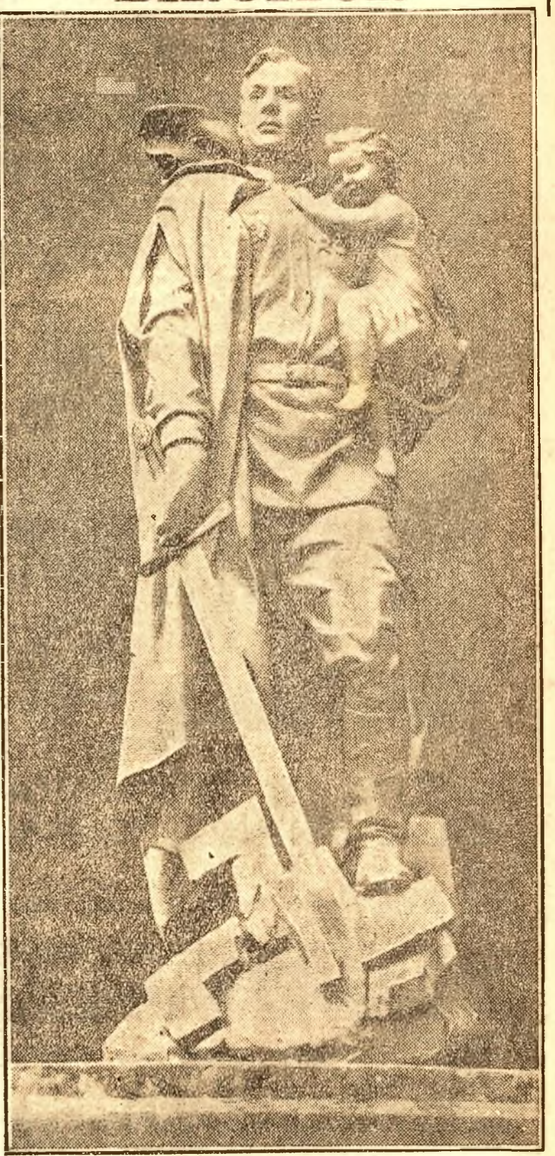
Un monument gigantic, reprezentând pe ostașul sovietic biruitor, va fi inaugurat la Berlin, în ziua de 7 Noiembrie 1948. Ostașul sovietic calcă în picioare ștampila sfărâșată. În mâna dreaptă el ține spada — simbol al puterii, — iar în stânga un copil — simbol al vieții.