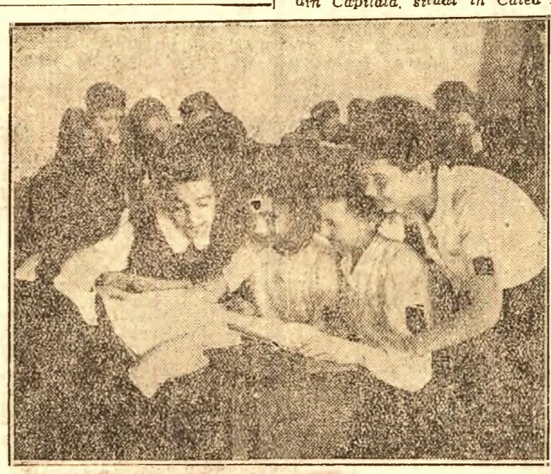
Iată un cerc de meditație. Meditatoarea, — una din elevete mai bune, — ajută pe celelalte colege să-și însușească materia. În felul acesta, numeroase elevete slabe și-au îndreptat notele pe semestrul al doilea.

De două luni de zile, se petrec în școli un lucru de o mare însemnătate pentru învățământul nostru public: ridicarea nivelului de învățatură prin munca în comun. Dacă analizăm situația de astăzi în școli, vom avea și mai bine în față, imaginea acestui proces, pentru a ne da mai bine seama de aceasta, să vizităm o școală, de pildă, Liceul Teoretic de fete No. 6 din Capitală, situat în Calea Rahovei.