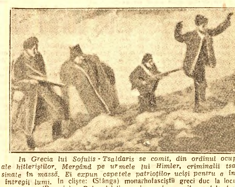
In Grecia lui Sofulis-Tsaldaris se comit, din ordinul ocupanților americani orori ce întrec prin cruzime odioasele crime ale hitleristilor. Mergând pe urmele lui Himler, criminalii tsaldariști reînvie obceșurile eului lui mediu, prin torturi și asasinări în masă. Ei expun capetele patrioților uciși pentru a înfricoșa populația. Spectacolul e înfiorător și înfiorător revolta întregii lumi. In clipse: (Stânga) monarhifasciști greci duce la locul de execuție un patriot făcut prizonier în regiunea Koniza. (Dreapta): Doi patrioți greci au descoperit capetele tovarășilor uciși mișcându-se de călăii fasciști în reținex lanța.