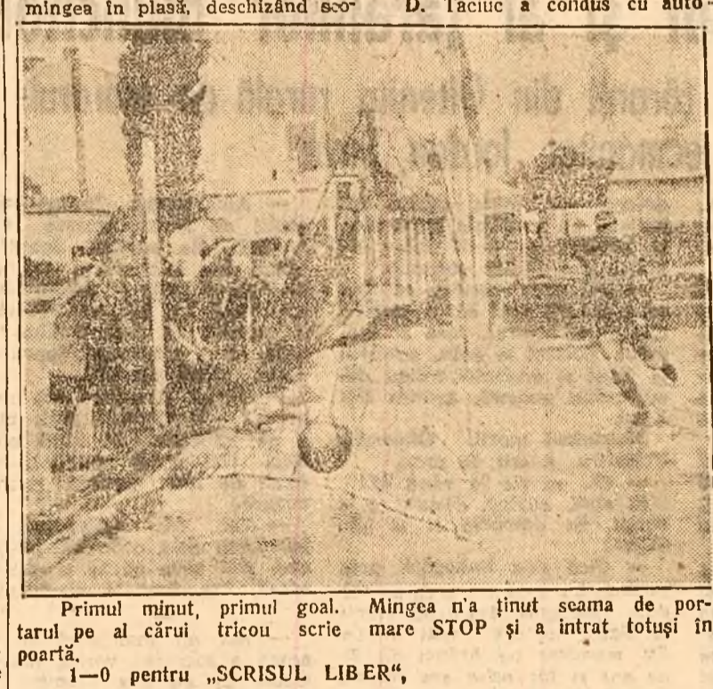
Primum minut, primul goal. Mingea n'a fost scama de portarul pe al cărui tricou scrie mare STOP și a intrat totuși în poartă.

TORINO: Cucerind trei victorii în matchul de tennis cu Danemarca, Italia s'a calificat pentru turul următor al Cupei Davis. PRAGA: In întâlnirea contând pentru Cupa Davis, Cehoslovacia a învins Belgia cu 3:2. Învingătorii vor întâlni Italia. LONDRA: Anglia a învins Olanda cu 4-1 în matchul de tennis ce a contat pentru Cupa Davis.