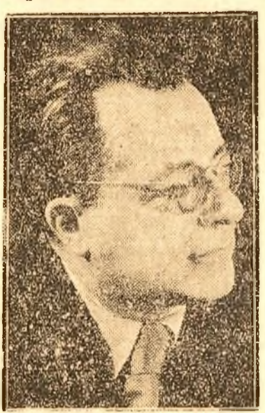
PALMIRO TOGLIATTI Secretar general al Partidului Comunist Italian

ROMA, 13 (Radior). — TASS transmite: Secretarul general al Partidului Comunist Italian Palmiro Togliatti, în rostind un important discurs în Camera Deputaților, în timpul dezbaterilor asupra programului propus de guvern, a spus că declarația lui de Gasperi este „un document neînțeles” care evită să aibă chestiunile conorote puse de actualele împrejurări istorice și nu corespunde așteptărilor primului parlament al Republicii, care ar fi trebuit să pună în aplicare constituția și reformele sociale sancționate de ea. Guvernul așa cum reiese din declarația sa, își propune să amâne sine die chestiunea aplicării reformelor.