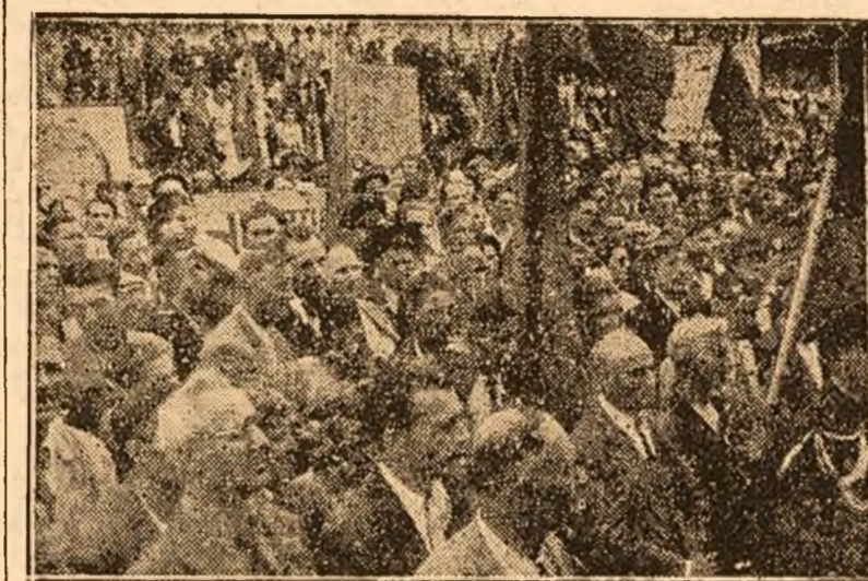
Muncitorii gălățeni participă la comemorarea zilei de 13 Iunie 1916.

GALAȚI, 14. (Prin telefon). — Tov. Miron Constantinescu, membru al Biroului Politic al Comitetului Central P. M. R., ministru al Minelor și Petrolului și deputat de Cuvurliu, a vizitat brașul Galați în ziua de 13 Iunie 1948.