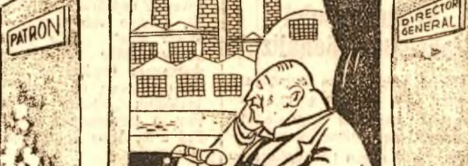
Înainte de „naționalizarea” laburistă

Naționalizările făcute de laburisti în Anglia, nu numai că au scăpat de capitaliștii de întreprinderi nerentabile cu utilități vechi, dar ei au și primit despăgubiri mari rămânând să conducă tot ei minele.