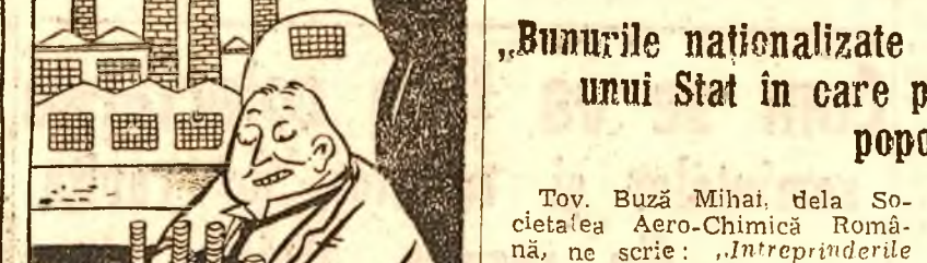
După „naționalizarea” laburistă