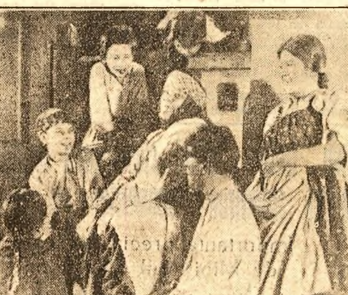
lată o scenă din monumentală realizare sovietică „Viața lui Maxim Gorki”, a cărei primă parte — „Copilaria lui Gorki” — rulează cu începere de astăzi la cinematografele Aro și Grădina Progres. Citiți în pagina 2-a CRONICA FILMULUI