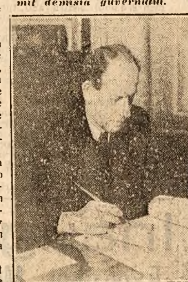
ANTONIN ZAPOTOCKY Cu constituirea noului guvern a fost învestit Antonin Zapotocky, fost vicepreședinte al constituit în guvernul demisionat.

PRAGA, 15 (Rador). — TASS transmite: În ziua de 14 Iunie, Clement Gottwald, președintele Republicii Cehoslovace, a primit demisia guvernului.