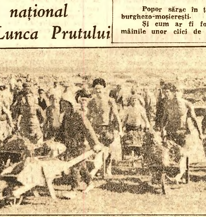
Intrecerea între cele trei mari șantiere naționale, insufletește munca, scurtează timpul fixat pentru terminarea marilor lucrări începute.

Ca un parazit urmas, cu mii de ghiare, se întindea asupra țării stăpânirea celor 100 de familii de jefuitori. Mână în mână lucrau membrii celor 100 de familii: pentru a sorașce bogățiile țării, pentru a suga viața poporului muncitor. Și chiar dacă se certau uneori —