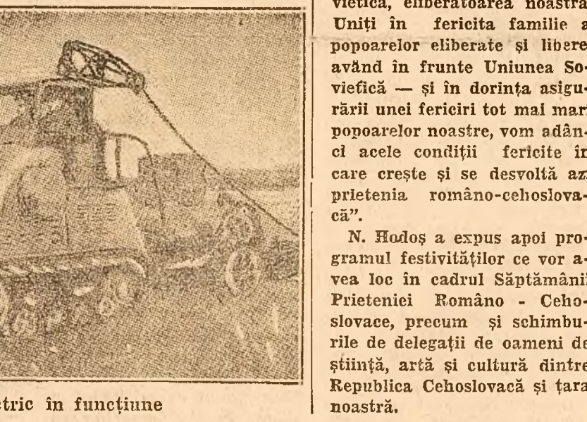
Un tractor electric în funcțiune