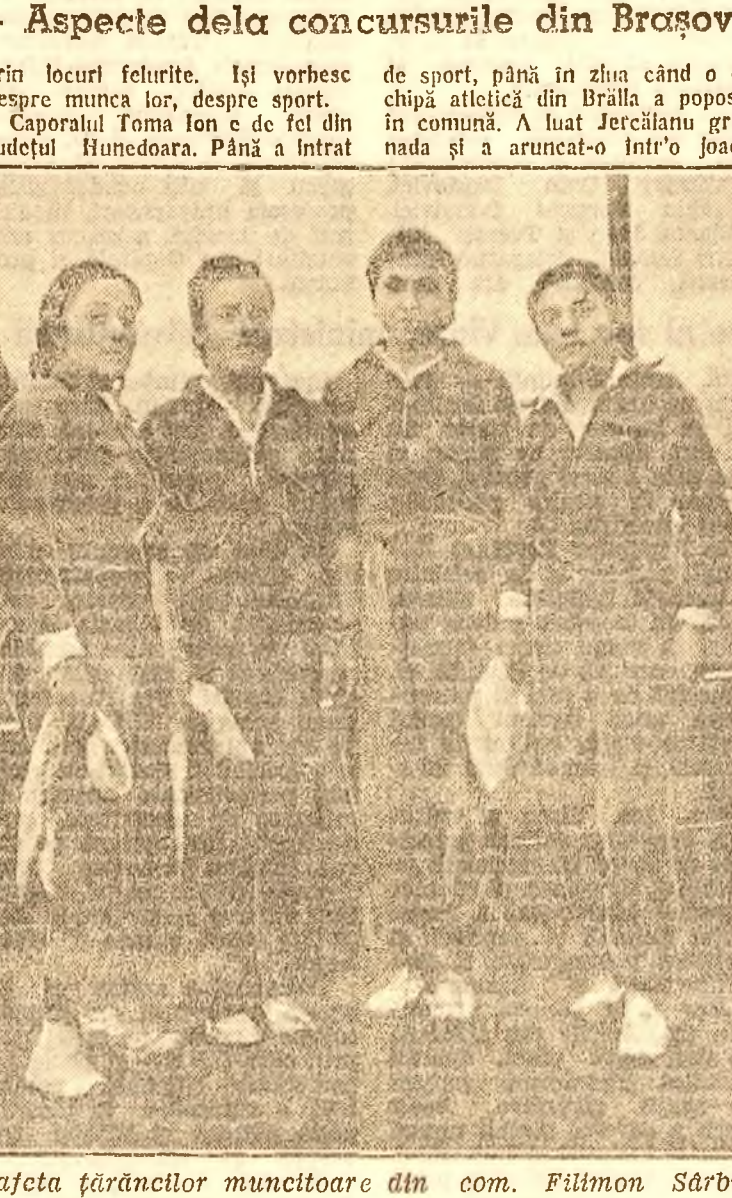
Stațeta fărâncilor muncitoare din com. Filimon Sărbu