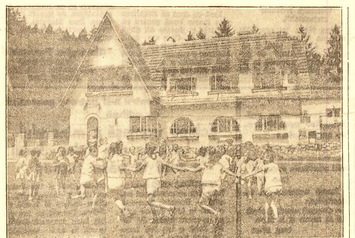
Copiii dela câmpul întreprinderii „Donca Simo” din București au încins horă veselă pe pajiștea inundată de soare și lumină din curtea coloniilor de vară din Timișul de Sus-Brașov.

Numeroase echipe culturale vizitează pe oamenii muncii plecați la odihnă TIMISOARA. (prin telefon dela corespondentul nostru).