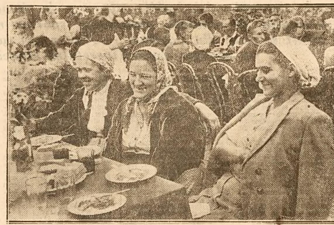
Masă într'un colhoz din Cuban, în cinstea delegației de țărani muncitori din țara noastră. Voia bună se citește pe fețele tuturor

Acuesta se datorește agriculturii socialiste, se datorește faptului că în Uniunea Sovietică colhoznicii ajutați de tractoriști, își lucrează pământurile așa cum se cuvine, după metode științifice și astfel pe întinderi mari de pământ dobândesc recolte bogate și sunt oameni instăriți.