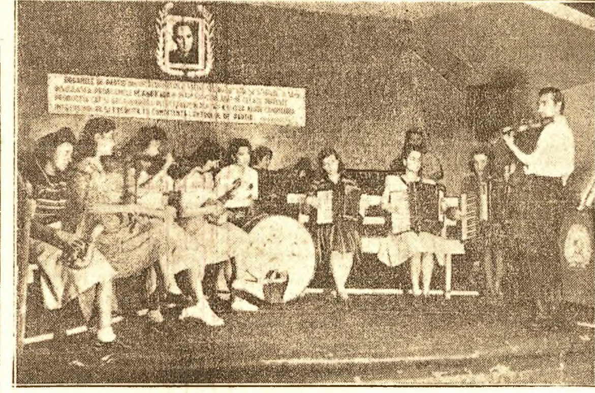
Orchestra de fenei dela fabrica „Dâmbovița” repelă cântecce, scris special de numeroși compozitori pentru „Ziua Scântei”.