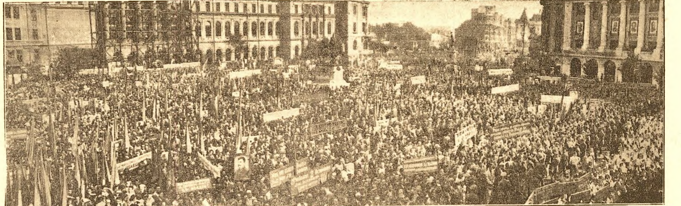
UN ASPECT AL GRANDIOASEI MANIFESTAȚII PENTRU PACE DIN PIAȚA UNIVERSITAȚII