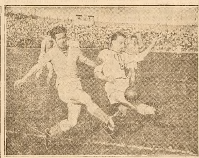
O fază a matchului C.F.R.B. — DINAMO A.