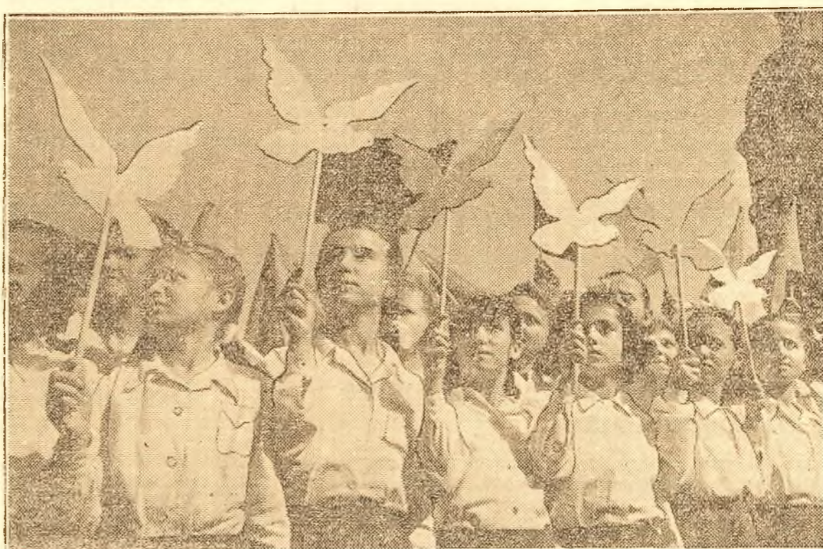
Și copiii orfani au venit să manifesteze pentru pace

„Puterea sovietică își dătoarează popularitatea mai mult decât toate politiciile de pace dusă cinstit și cu bărbăție în condițiile grele ale încercării capitaliste”, a spus încă din 1924 tovarășul Stalin, genialul conducător al popoarelor sovietice.