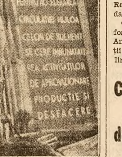
Tov. Vasile Luca rostitându-și cuvântarea

în activitatea economică a întreprinderilor. Muncind cu eelan sporit, introducând un control serios, o mai bună organizare a muncii — vom putea realiza acumulări socialiste din ce în ce mai mari, vom putea accelera ritmul dezvoltării noastre în toate domeniile, vom putea ridica nivelul de trai, nivelul