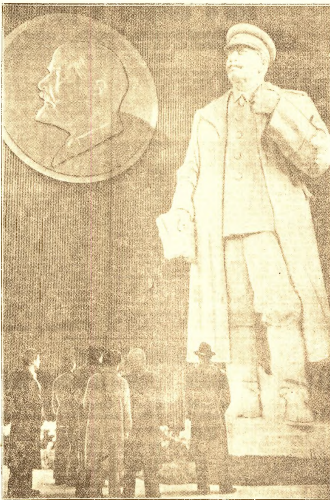
IOSIF VISSARIONOVICI STALIN

De nesfruncinat este prietenia popoarelor lumii cu poporul sovietic! Aceasta se desprinde limpede din standul alcătuit din exemplare ale presei progresiste de pretutindeni, presa care popularizează cu dragoste uriașele succese ale oamenilor muncii din U.R.S.S., conduși de glorioșul Partid Bolșevic, de înțeleptul învățător al omenirii muncitoare, Iosif Vissarionovici Stalin, Lenin de astăzi, inspirator și organizator al victoriilor poporului sovietic, stindard al luptei mondiale pentru triumful nobilei cauze a păcii.