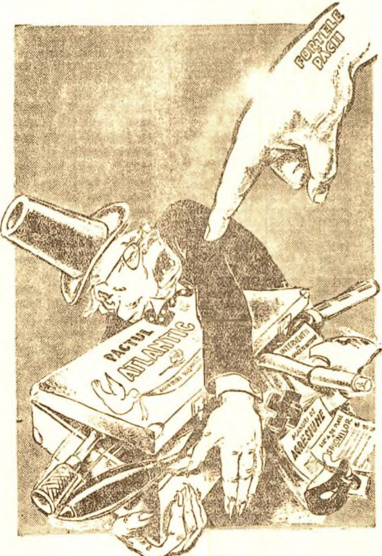
Reproducere după un desen de EUG. TARU