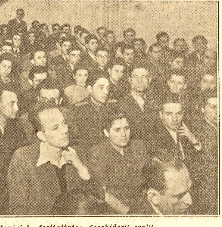
O parte a asistenței la festivitatea deschiderii școlii

Conform hotărârii Biroului Politic al Comitetului Central al P.M.R., Școala Centrală de lectori „A. A. Jdanov”, cu durata de 6 luni, a fost transformată în școala de științe sociale „A. A. Jdanov” cu durata de 2 ani.