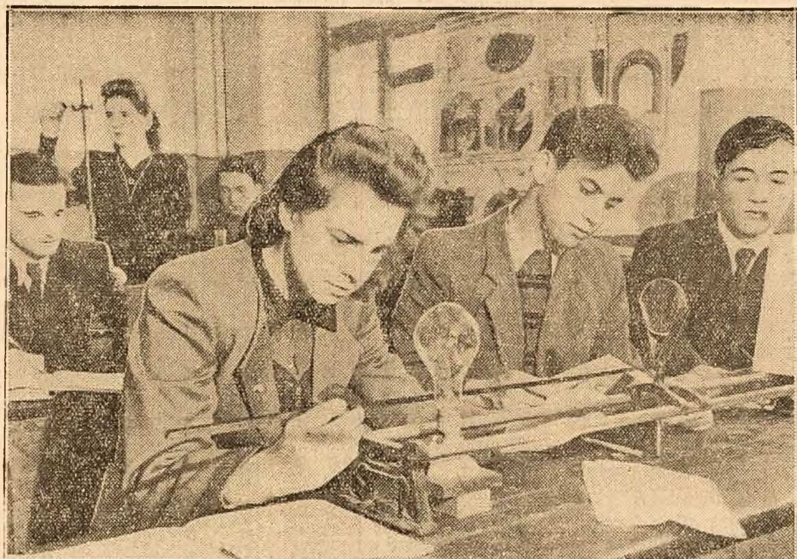
Chiar după terminarea școlii și intrarea lor în producție, tinerii sovietici continuă să învețe la cursuri speciale sau la școli serale de diferite grade. În cliseu: Tineri muncitori din întreprinderile industriale ale raionului Sverdlov din Moscova în timpul unei lecții de fizică la școala tehnică medie serală.