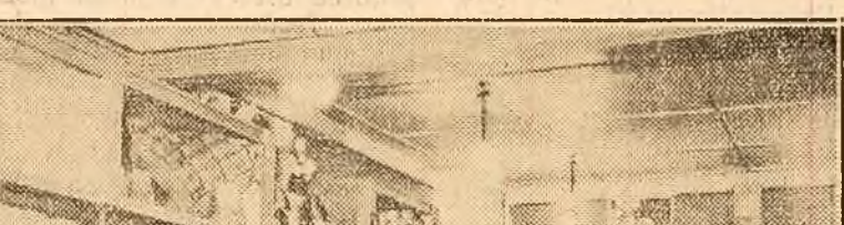
Interiorul unei cooperative sătești de consum din U.R.S.S.

Rasele jucăușe ale soarelui de primăvară se lovesc de geamurile vitrinelor și, sfioase încă, dar calde și mângâietoare, pătrund înăuntru, revărsând lumină în casa albă ce poartă firma „Cooperativa de consum a satului”.