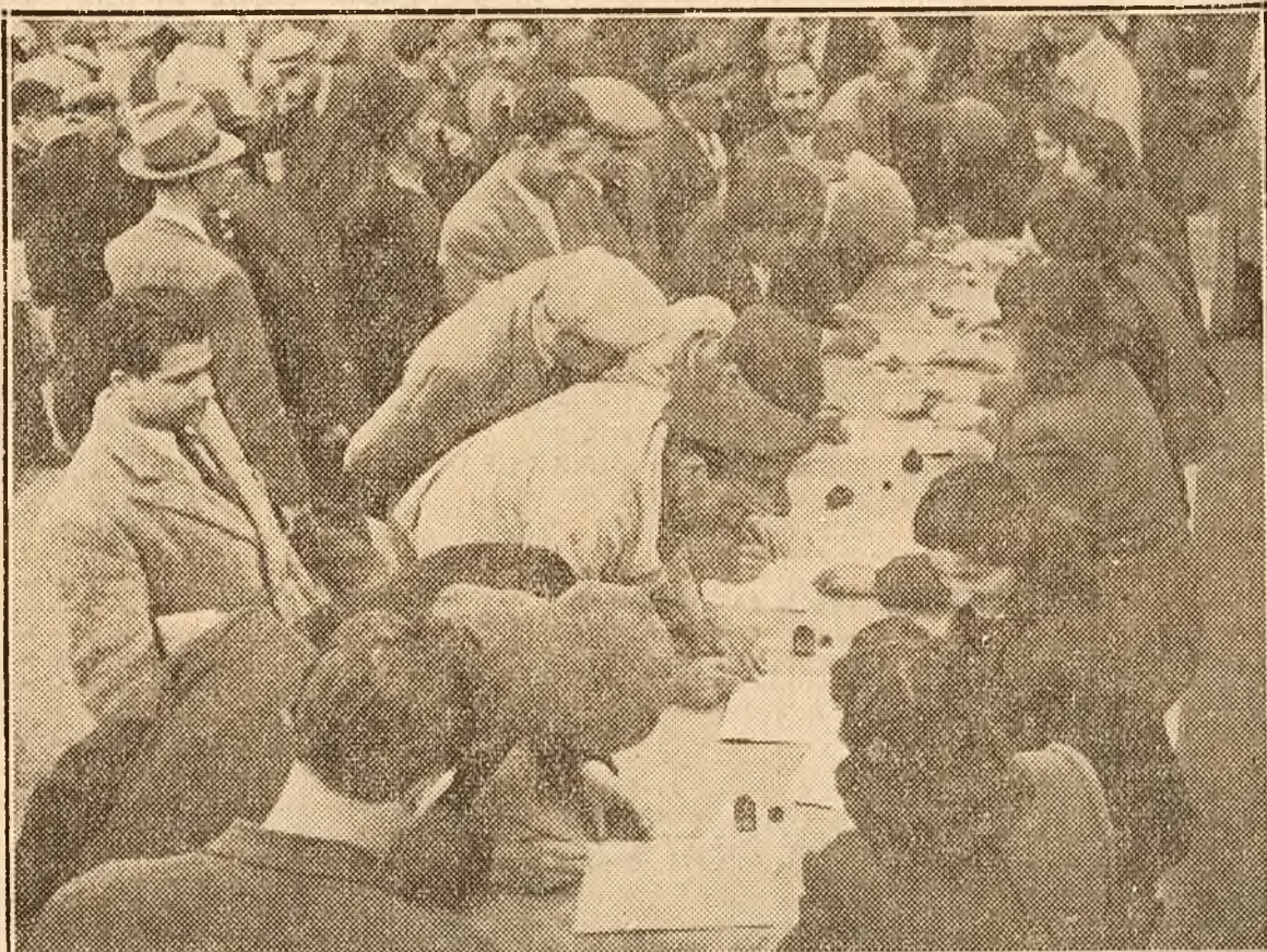
Mii de muncitori și tehnicieni dela Atelierele Grivița Roșie-Locomotive au semnat ieri cu entuziasm Apelul Comitetului Permanent al Congresului Mondial al Partizanilor Păcii.

La Grivița Locomotive, mii de muncitori au semnat Apelul Comitetului Permanent al Congresului Mondial al Partizanilor Păcii