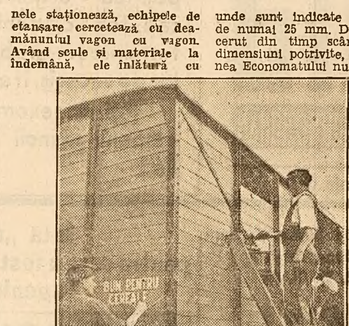
Incă un vagon gata, care așteaptă să fie reparaționat. Echipa de reparații a lucrat bine...