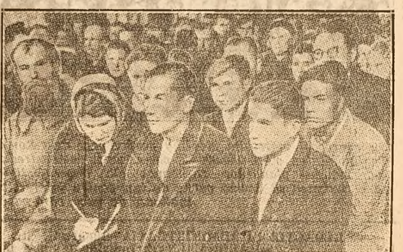
Colhoznicii ascultă cu cel mai mare interes expunerile oamenilor de știință.

Colhozul „Nakotne” (Vitorul) este una din gospodăriile agricole colective frunțose din R.S.S. Letonă. Pentru a veni în ajutorul construcției colhoznice din această tărâșă republică sovietică, Academia de Științe a R. S. S. Letonă a hotărât să convoace aici o sesiune științifică. În clubul colhozului, alături de colhoznicii din împrejurime au luat loc și oamenii de știință. Savanții au vorbit colhoznicilor despre metodele cuceririi ale științei agricole sovietice, arătându-le și cum trebuie puse în aplicare. Oamenii de știință au ajutat pe colhoznicii din „Nakotne” să alcătuiască un plan de muncă pe cinci ani.