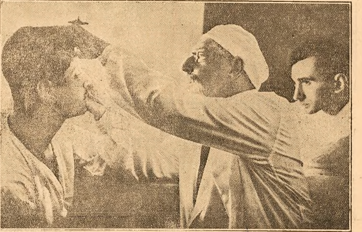
Numele academicianului Filatov este bine cunoscut atât în U.R.S.S. cât și dincolo de hotarele ei. Acest mare om de știință și-a închinat viața luptei împotriva orbirii. Datorită metodei sale de transplantare a corneei mii de orbi și-au recăștigat vederea, reluându-și locul în câmpul muncii și recăștigându-și întreaga dragoste de viață. În decurs de zece de ani de prodigioasă activitate științifică, academicianul Filatov a îmbogățit medicina sovietică cu peste 260 lucrări de mare valoare. Știința Sovietică a pus la dispoziția marelui om de știință o clinică înzestrată cu cel mai modern utilaj. Aci în clinica academicianului Filatov și la Institutul de boli de ochi din Odessa, care-i poartă numele, oculiștii sovietici își însușesc metodele lui Filatov, pentru a le aplica apoi pe scară largă. Pentru meritele sale deosebite i s'a acordat academicianului Filatov Premiul Stalin. În clipșu: Academicianul Filatov explică unui medic tânăr operația de transplantare a corneei.