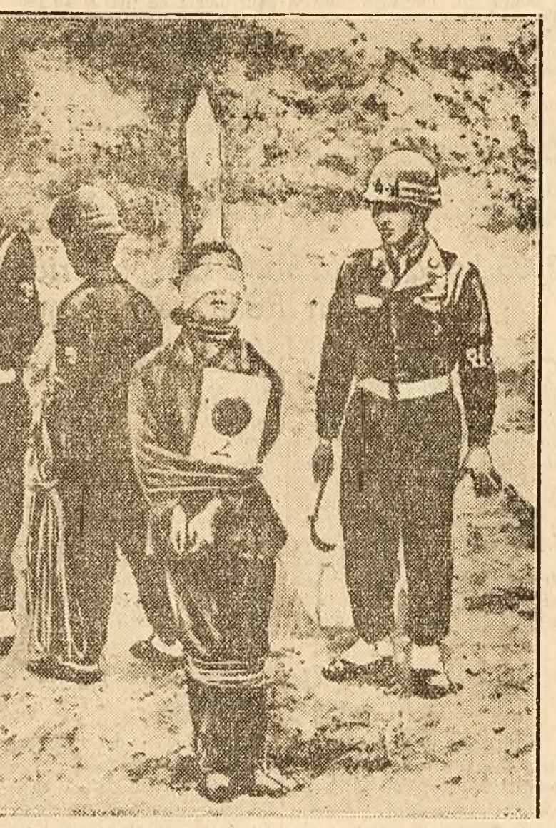
Călii au înconjurat o vitează patrioată coreeană. Mâinile femeii sunt strâns legate, o tranșie groasă îi pătrunde până la sânge în carnea picioarelor. Unul dintre căli i-a prins în piept o ființă. S'a temut să nu nimerescă alături, Ticălosului îi tremură mâinile! Alul i-a legat neînfricatăi femeii ochii. Cum ar fi putut el să suporte privirea ei plină de mânie și dispreț?