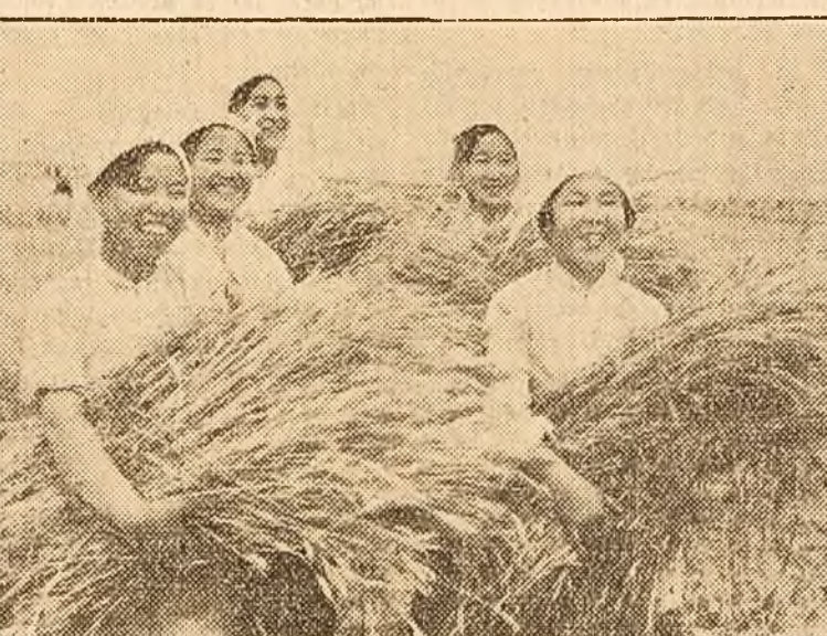
Cât de fericite sunt aceste tinere țărânci chineze, muncitorii dela Fermă de Siat Ci Henq!