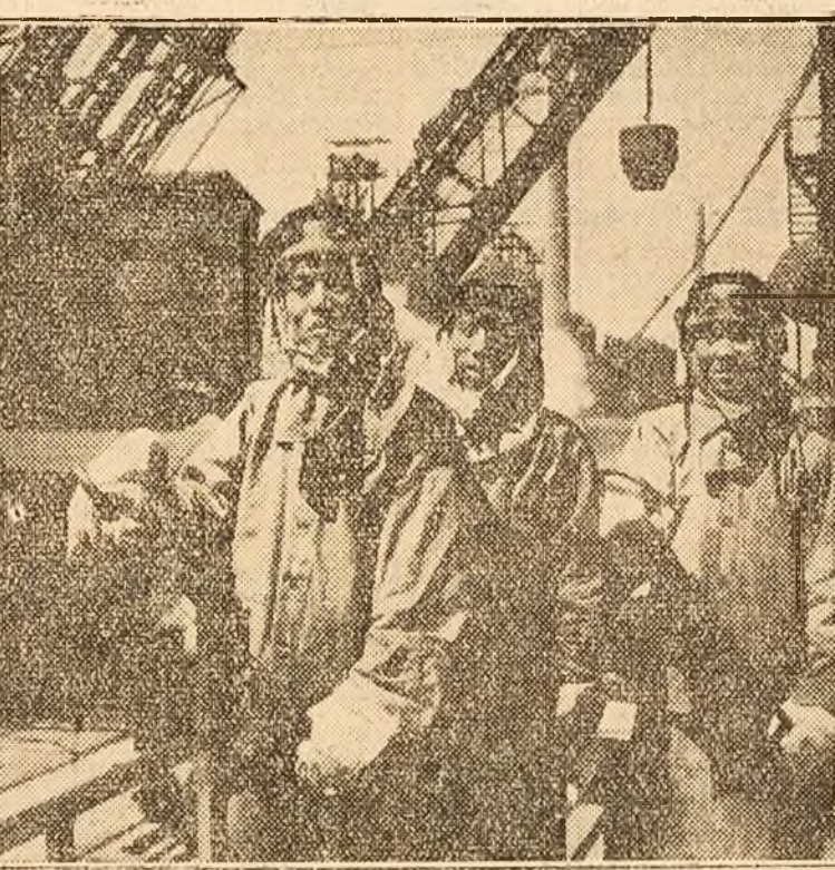
Oameni muncii din R. P. Chineză eliberați din jugul imperialismului...