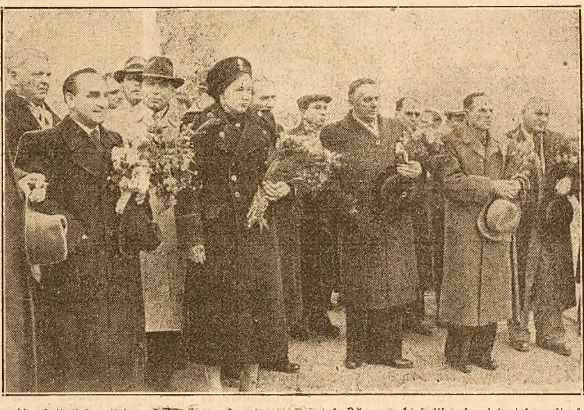
Membrii delegației sovietice la sosirea pe aeroportul Băneasa în mijlocul asistenței venite în întâmpinare