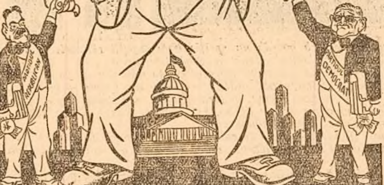
Desen de Doru

Tot cu prilejul încercării prelectorale a sluzilor vișelului de aur din Wall-Street a ieșit la iveală faptul că seții aparatului polițienesc din New-York — dintre care cei mai mulți sunt „democrați” (din partidul lui Truman) — primesc mită dela cele mai mari bande de gangsteri. A mai apărut faptul că șase dintre candidații ambelor partide din statul New-Jersey au stors prin șantaj dela funcționarii municipali, numai în ultimii doi ani, aproape 500.000 dolari, și câte și mai câte. Această spălare a rușilor murdare în piața publică, pe care a prilejuit-o campania electorală americană, dă oricărui om cinstit o idee despre cine sunt „alesii” în democrația trusturilor. Cu asemenea indivizi își pune Wall-Street-ul în apli-