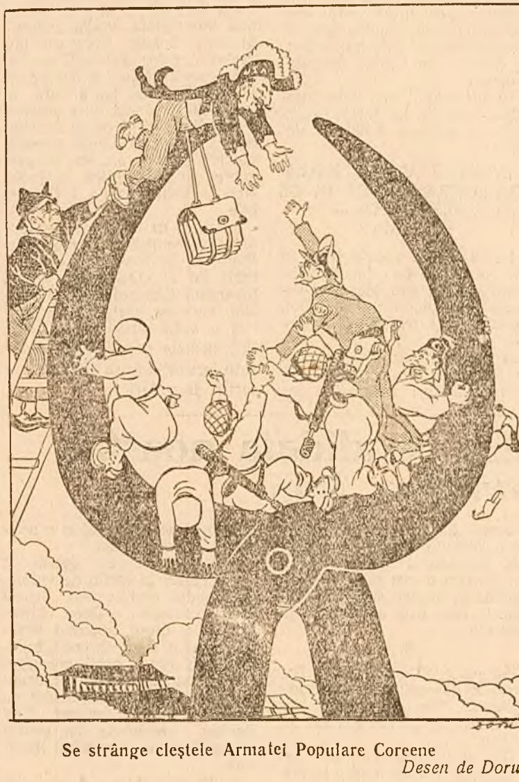
Se strânge cleștele Armatei Populare Coreene. Desen de Doru

Pe coasta de răsărit, sub presiunea unităților Armatei Populare, inamicul a continuat să se retragă din regiunea Ranan spre Sud, dealungul coastei. COREEA DE NORD 5 (Agerpres). — După cum transmite corespondentul special al Agenției CHINA NOUA, trupele americane în retragere au dat foc Ursanului înainte de a fugi din acest oraș. „Când am intrat în oraș împreună cu voluntarii chinezi — scrie corespondentul — am găsit orșul în flăcări. Din cele 300 locuințe din oraș,