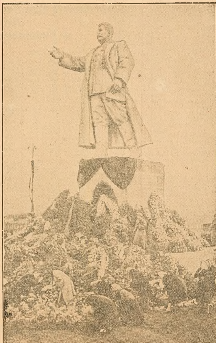
Oamenii muncii din Capitală depun flori la picioarele statuii lui I. V. Stalin

Numele nemuritor al lui Stalin va trăi totdeauna în inima tineretului și a întregului nostru popor.