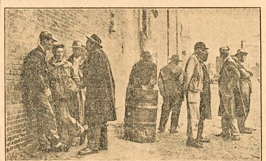
Docheri fără lucru așteptând să fie angajați în portul New York

Până și unele dintre publicațiile reacționare americane sunt nevoite să recunoască mizeria copleșită în care se sbat milioane de muncitori în S.U.A. Iată, de pildă, cum descrie revista „New York Times Magazine” viața amară a docherilor din New York, pe care li numește „oamenii ultiți de pe țărmuri”.